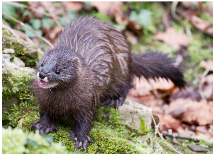
Vison d'Europe ( Mustela lutreola )

Consultez la page internet dédiée au PNA : beaucoup d'informations et de documents y sont téléchargeables.