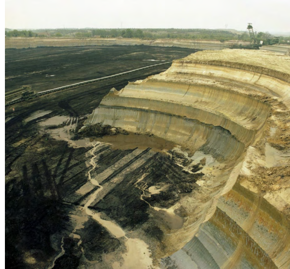
Site d'Arjuzanx au XX e siècle, lors de l'exploitation à ciel ouvert de gisements de lignite

Thomas FLORANE & Léo BARETS Syndicat Mixte de Gestion des Milieux Naturels