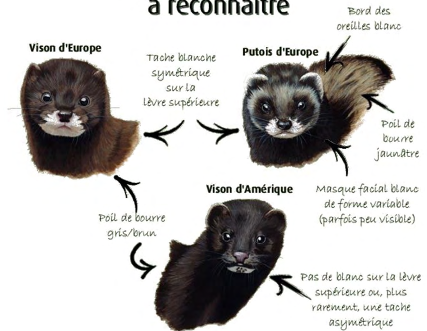
Critères de distinction entre les Visons d'Europe et d'Amérique et le Putois d'Europe

bois, des troncs creux, voire des embâcles. Les zones cultivées peuvent également être occupées à condition que la structure de la végétation offre un couvert suffisant pour permettre aux individus de se déplacer en sécurité pour rejoindre une autre zone favorable. Le domaine vital du Vison d'Europe varie entre 0,6 km et 17 km de cours d'eau, soit environ 3,6 ha à 100 ha d'habitats fluviaux. Comme la Loutre, le domaine vital d'un mâle englobe ceux de plusieurs femelles.