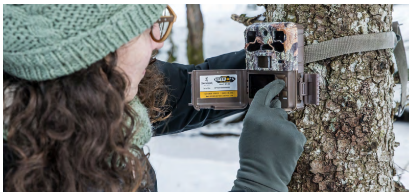
Pose d'un appareil photo à déclenchement automatique