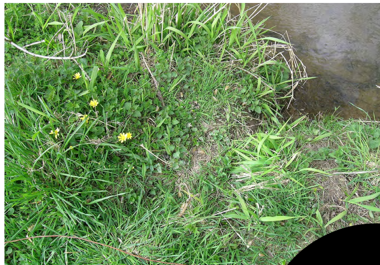
Coulée de Loutre

Afin de maximiser les chances de capturer l'image d'une loutre de passage, veillez à sélectionner un lieu facile d'accès et présentant un intérêt pour l'espèce, en bordure d'un cours d'eau ou d'un plan d'eau (étang, mare). Privilégiez un lieu de marquage régulier ou susceptible d'être opportun pour la Loutre, tels qu'une pierre, un tronc d'arbre, une butte herbeuse ou encore une coulée. N'hésitez pas à consulter le n°1 de « La Catiche » pour plus d'informations sur les indices de présence et les lieux