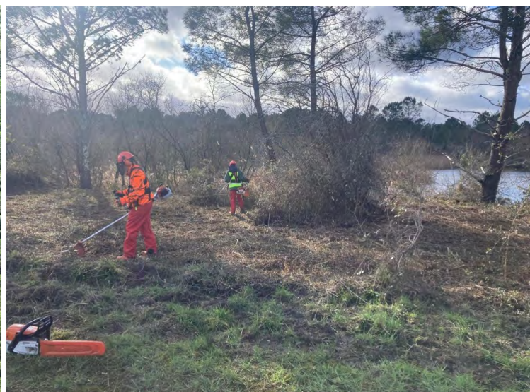
Travaux de réouverture des milieux réalisés avec des étudiants du lycée professionnel agricole et forestier Roger Duroure