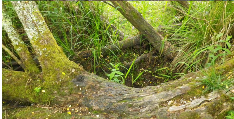
Zones stratégiques de marquage pour la Loutre